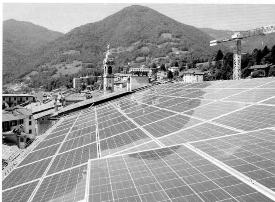
Un particolare dell'impianto.

Ci siamo avvalsi della partnership della ditta ENERGE che ha creduto al progetto, concretizzando tutte le idee e i buoni progetti attesi, insieme al Comune di Gazzaniga, il quale ha richiesto e ottenuto un contributo dalla Regione Lombardia pari a 150.000 Euro. Grazie a questi interventi i consumi di energia elettrica dei due complessi si ridurranno considerevolmente, con un cospicuo risparmio economico ed ecologico per il futuro, oltre a dare un forte segnale di innovazione e cura del patrimonio edilizio.