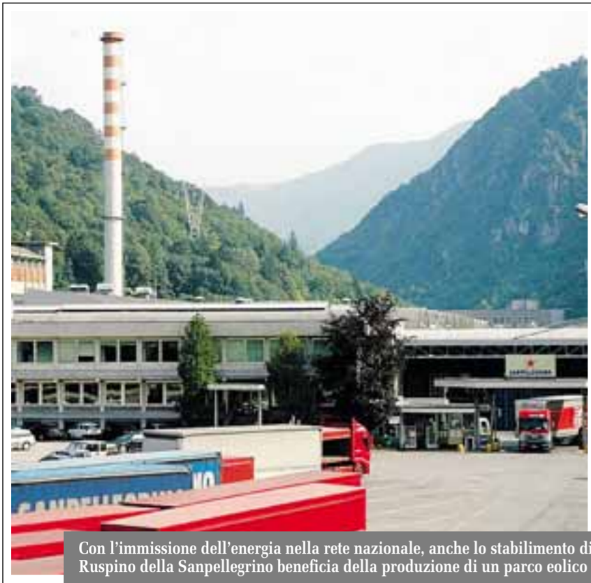
Con l'immissione dell'energia nella rete nazionale, anche lo stabilimento di Ruspino della Sanpellegrino beneficia della produzione di un parco eolico