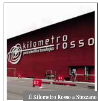
Il Kilometro Rosso a Stezzano